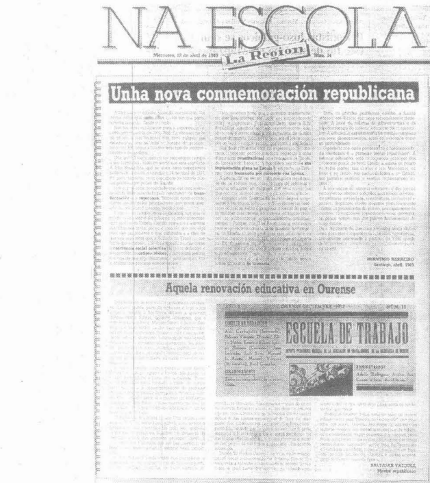
Este ano non hai número sobre educación republicana por coincidir vacacións.

A segunda etapa, dos números trece ao coarenta e catro, corresponde ao curso 88-89, e supón a consolidación en Ourense, cun consello de redacción integrado por seis persoas en Ourense e