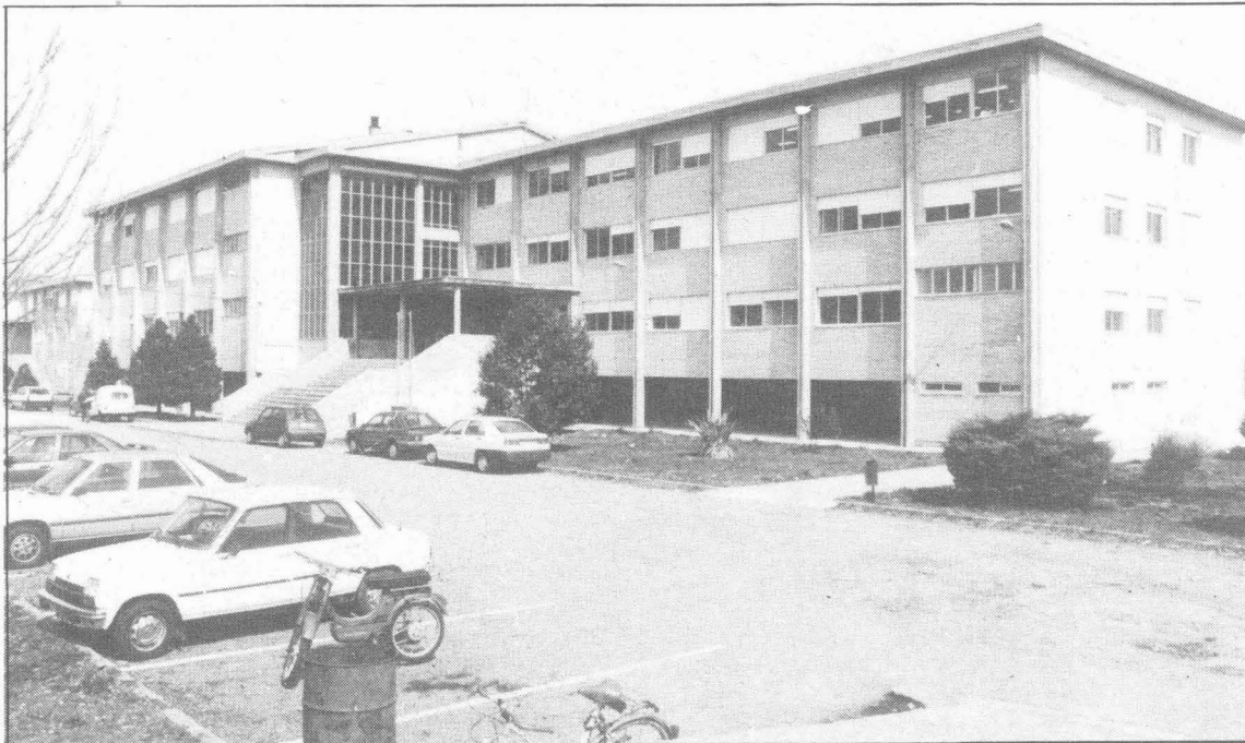
O "affaire Xinzo" puxo de manifesto a dupla misión que teñen que exercer os docentes.

O recente "affaire Xinzo" pode servir, cando menos, para por de manifesto a dupla misión que teñen que exercer os docentes: académica e administrativa (onde incluímos os aspectos disciplinares). No presente artigo, o que pretendemos é facer unha análise desta dupla misión coa intencionalidade de chamar a atención sobre un aspecto tratado en diversos ámbitos docentes: a separación, como acontece noutros diversos Estados, destas dúas misións.